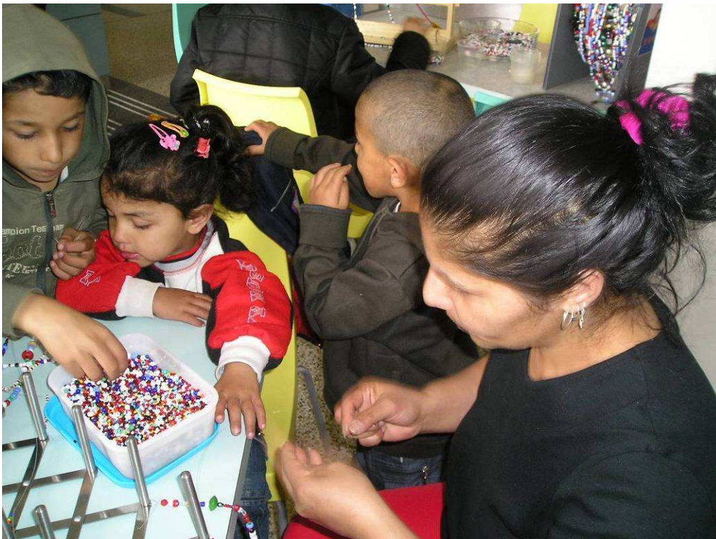
Navlékání ve vestibulu muzea