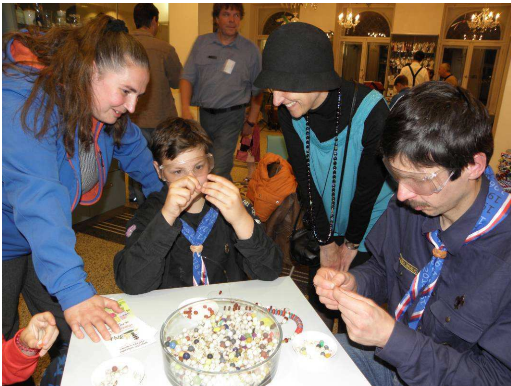
Navlékání při Muzejní noci

V muzeu vyvrcholilo navlékání o Muzejní noci 18. května a následující den v sobotu 19. května, kdy se navlékalo i na jabloneckém Dolním náměstí.