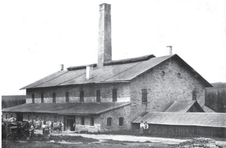
Sklárna na Jizerce, fotografie, počátek 20. století, sbírka MSB Jablonec n. N.

bylo 105 sklářským mistrům vyplaceno téměř 78 000 zlatých [22] .