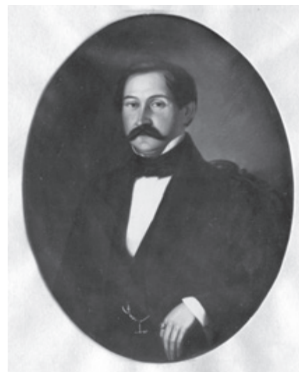
Josef Riedel, fotografie obrazu z 50. let 19. století