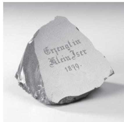
Z první tavby avanturinu na Jizerce, 1879, sbírka MSB Jablonec n. N.