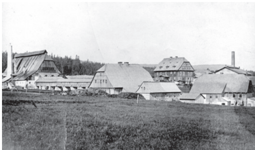
Sklárna Jizerce, fotografie, před 1903, archiv autora

Podle Fahdtova adresáře vydaného v průběhu roku 1879 polubenská firma v Jizerských horách provozovala 11 sklářských pecí na otop dřevoplynem nebo uhelným plynem s celkem 76 pánvemi [21] . Rok poté šest skláren v Polubném, Kořenově, Nové Vsi, Maxově a na Jizerce utavilo přes 5 000 tun skla. Největší objem připadal na bižuterní polotovary (2 100 t), dále flakóny (2 000 t) a duté sklo (900 t). Na mzdách