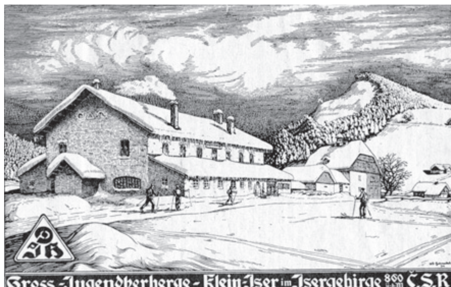
Sklárna na Jizerce jako ubytovna, reprodukce grafiky, 1934, archiv autora

Po smrti Josefa Riedela stanul v čele firmy Jos. Riedel nejstarší z bratrů Wilhelm Riedel (1849–1929), který ji již fakticky řadu let vedl. Riedelovská expanze nadále zdárně pokračovala a stoupající poptávka vedla ještě do konce století k investicím, jež se dotkly všech oborů, v nichž společnost podnikala. Podle inventury majetku po zemřelém Josefu Riedelovi, datované 18. ledna 1896, víme, že hodnota sklárny na Jizerce tehdy byla 48 112 zl., 95 krejcarů (uskladněno zde bylo sklo za 34 500 zl). Uvážíme-li že, obě moderní pířchovické sklárny komise ocenila