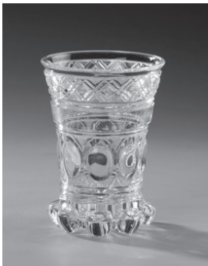
Pamětní číše – první tavba 1. září 1829, ručně foukané, broušené a ryté sklo, Jizerka, sbírka MSB Jablonec n. N.

lem se stal třináct let poté. Byl to schopný huťmistr a obchodník, jehož ambicí bylo též provozovat vlastní rafinerii skla a získat prestižní titul c. k. privilegiované továrny na výrobu skla, což se mu však díky pomlouvačné kampani konkurentů ze severu Čech (do níž se zapojila i nedaleká sklárna hrabat Harrachů v Novém Světě) a nepřízni centrálních úřadů nepodařilo.