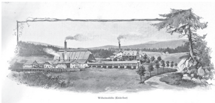
Sklárny na Jizerce, reprodukce grafiky, 1898, archiv autora