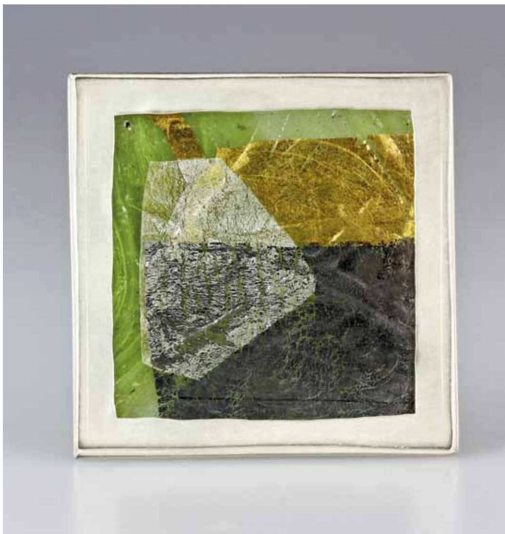
Brož, sklo, pigmenty kovů, 2010