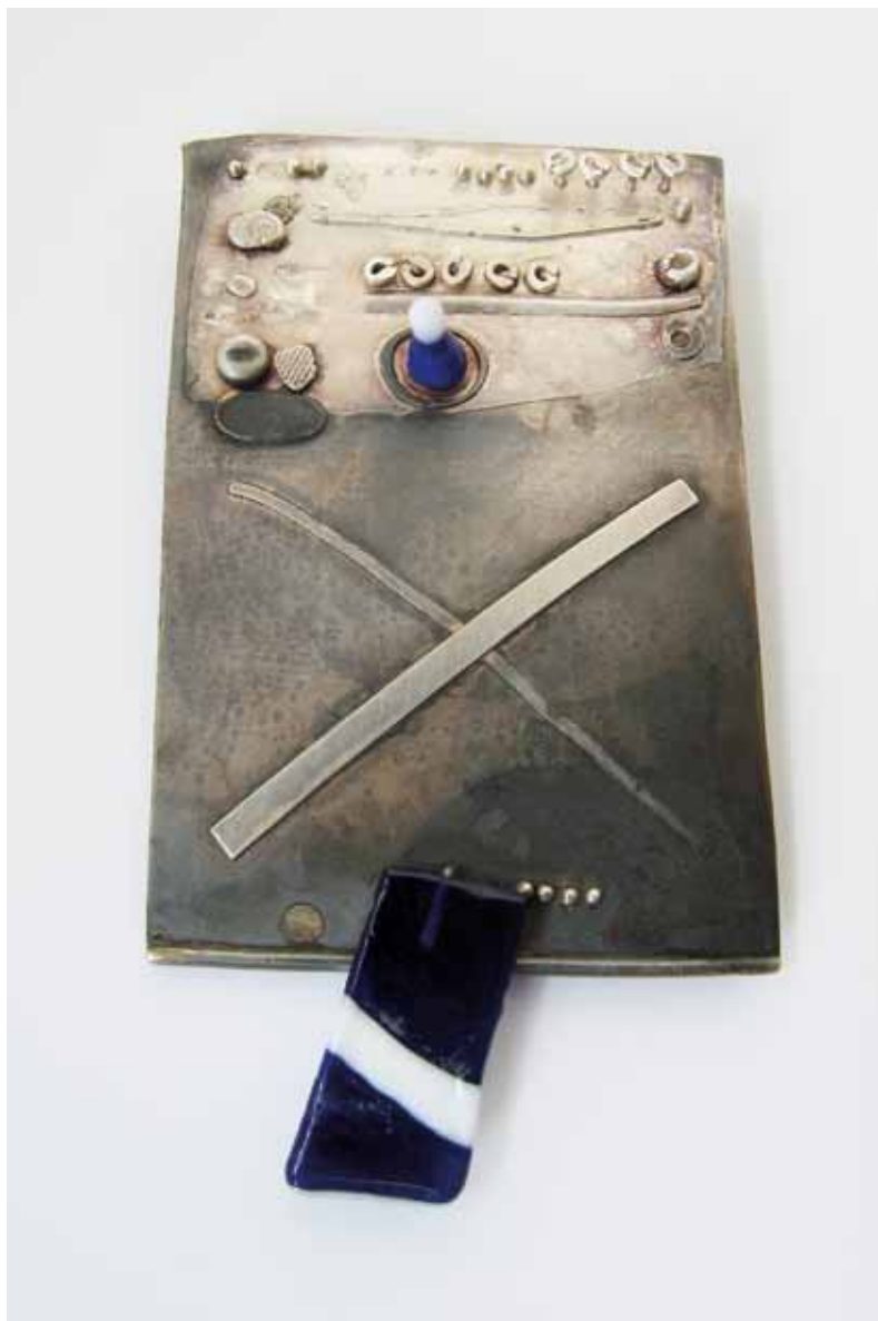
Brož, 1973, stříbro, sklo

jistý zřetelný rytmus. Hlavní váha ležela na průzkumu a poznání materiálu a také na možnostech jeho tváření s cílem převést hmotu do estetického výrobku. Další tvůrčí fáze je však zcela odlišná. Namísto jemně barevné a transparentní skloviny využívá sklovinu opakní, sytých barev s velkými barevnými kontrasty například černo-bílé, červeno-bílé, modro-zelené. Docílené efekty jsou bližší bižuterii, zdají se být také módnější. Série těchto šperků byla vystavena na V. Mezinárodní výstavě Jablonec '77, kde za ně autor získal bronzovou medaili. Tato Kodejšova tvůrčí fáze je krátká, neboť jeho šperky rozhodně nechtějí sledovat módní vlny. I přesto mu tato etapa přinesla nové poznání. Stavěním různobarevných tenoučkých skleněných tyčinek mu před očima vznikají millefiori, tedy drobné skleněné květy, které jsou známé z tradiční sklářské výroby v Itálii.