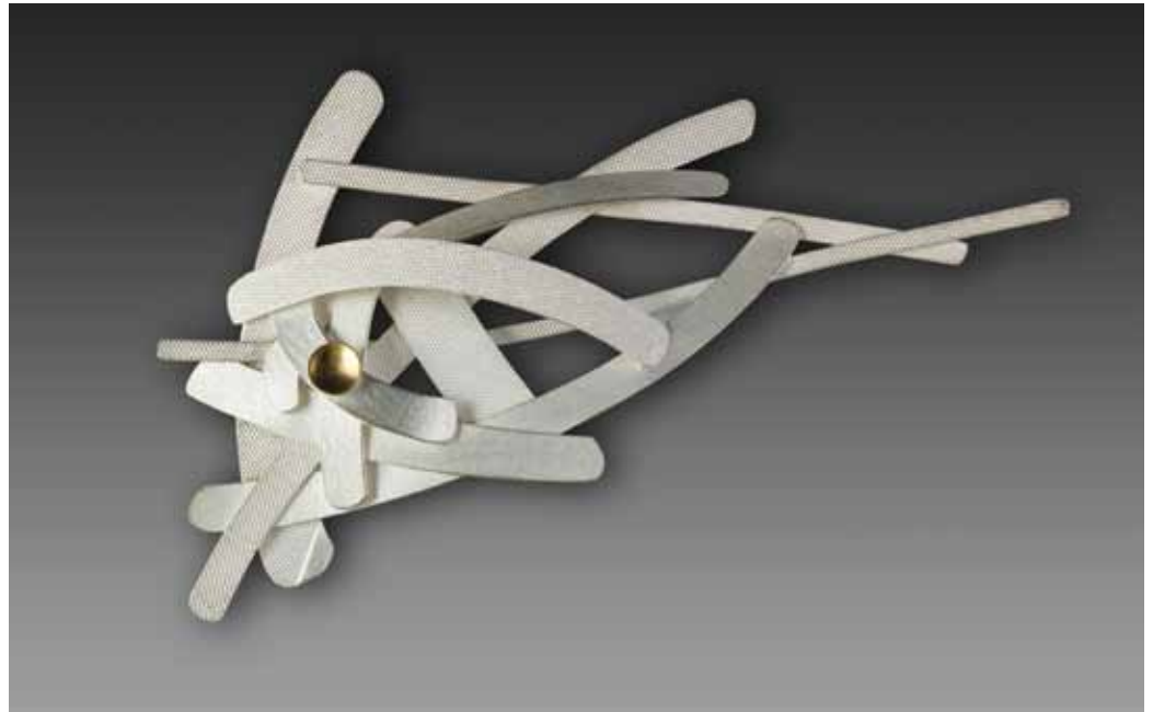
Brož, stříbro, 2012, foto archiv autora

inspiraci všude kolem sebe. Zejména v krajině a přírodě, v nadhledu, ale i v mikrosvětě. Ze střídání rytmů a blízkých či vzdálenějších pohledů na svět kolem vznikaly všechny jeho šperky, v nichž zúročil svůj výtvarný talent, řemeslný um a preciznost.