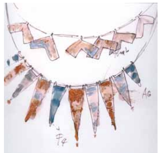
Skicy náhrdelníků, kolem 2010