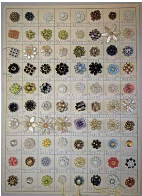
Obr. 1: Knoflíky, skleněné perle a perličky, obecný kov, ručně zhotovované tzv. šitím na sítku, Železnobrodské sklo, Železný Brod, po roce 1965