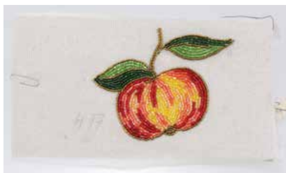
Obr. 6: Našivka, skleněné perličky – čípky, dvoukrátký, organtýn, nitě, tamburovaná výšivka, Jablonecké sklárny, k. p., závod Zásada, Jarmila Hlavová, 1985–1990