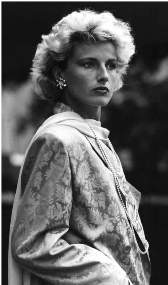
Obr. 9 Módní přehlídka, VIII. Mezinárodní výstava bižuterie Jablonex '83, Jablonce nad Nisou, 1984, MSB, Archivní sbírka, Sběrka dokumentů k mezinárodním výstavám bižuterie, r. 1984

Tato expozice prezentovala ženu ve společnosti, v domácím i pracovním prostředí nebo při sportu a obsahovala expozici skla, kožichů, módy a textilií, které doplňovala bižuterie. Tuto prezentaci ale s odstupem času nelze vnímat jen negativně. Bižuterní podniky rozhodně obstály a dokázaly, že se jejich výrobky hodí pro každou příležitost a také k pracovnímu oděvu. Kolekce čítající 50 kusů denní a 30 kusů večerní bižuterie pocházela z ŽBS a Bižuterie, která zde prezentovala především vysoce módní eloxovaný hliník. Odůvodněním pro změny se stalo i paralelní konání V. celostátní výstavy bižuterie v Jablonci nad Nisou. Rozhodnutí padlo již o dva roky dříve. V rámci plánu třetí pětiletky se doplňkem pro tzv. hlavní textilní a sklářskou výrobu stala bižuterie, obuv a módní doplňky. 36 Návštěvníká veřejnost reagovala negativně. A nakonec bižuterie chyběla i úředníkům a politikům. Na základě toho vládní komise pro výstavnictví vznesla na svém jednání 19. listopadu 1963 požadavek, aby se součástí příštích LVT stala „důstojná expozice skla a bižuterie v rozsahu, který bude přitažlivý také pro zahraniční turisty a obchodní zámce.“ 37