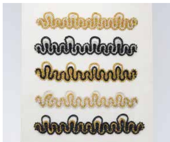
Obr. 7: Vzorkovnice prýmků, skleněné perličky – rokajl, nitě, technika šlingrování, Železnobrodské sklo, n. p., Železnobrodsko, kol. r. 1950