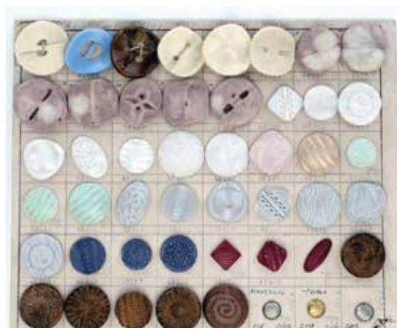
Obr. 2: Vzorkovnice knoflíků – výřez, plastická hmota, Skleněná bižuterie, n. p., Jablonec nad Nisou, řady 1, 2, design Jaroslav Kodejš, 1960–1965

flíky se vyráběly v závodech ve Smržovce a v Hraničném. Pro Smržovku se staly typické knoflíky náročných tvarů, zušlechťované povrchovými úpravami, které jim dávaly luxusní vzhled. Časté jsou vakuové dekory, listry, zlacení, stříbření, stříkání nebo zatírání a malba barvou. Sortiment obsahoval i levnější konfekční knoflíky. Ve sbírce MSB je zastoupen soubor 210 vzorkovnicových karet knoflíků pro sériovou výrobu. Československé zákaznice znaly zde vyráběné knoflíky prodávané i v tuzemských galanteriích, a to především pod obchodní značkou Ele-gant . Druhým závodem SB byla Hraničná, kde výroba skleněných knoflíků vysoké kvality probíhá i dnes. Produkce Hraničné zahrnovala knoflíky určené k dekoraci obtisky a sítotiskem. Právě zde se zhotovovaly i oblíbené dětské knoflíky podle vzorů M. Kourkové (obr. 3). Další skupinu tvoří kovové knoflíky z nabídky podniku Bižuterie, z nichž nejluxusnější výrobky zahrnovaly manžetové knoflíčky ze závodu 2, zaměřeného na výrobu z drahých kovů. V rámci závodu 6 – Silka byla zhotovována široká škála knoflíků jak z litiny, často kombinované se skleněnými kameny, tak z hliníku. Design knoflíků často korespondoval s aktuálními vzory v rámci celých linií (obr. 4).