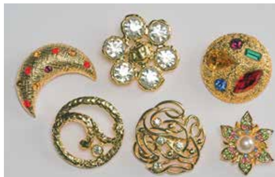
Obr. 4: Knoflíky, litý obecný kov v pokovení zlato, skleněné kameny, Bižuterie, n. p., závod Silka, kol. r. 1985