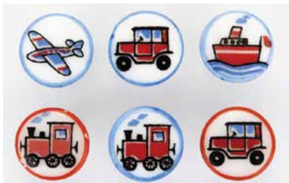
Obr. 3: Dětské knoflíky, mačkané sklo, obtisky, Skleněná bižuterie, n. p., Jablonec nad Nisou, závod Hraničná, design Marcela Kourková, Jablonec nad Nisou/Hraničná, 1965–1975